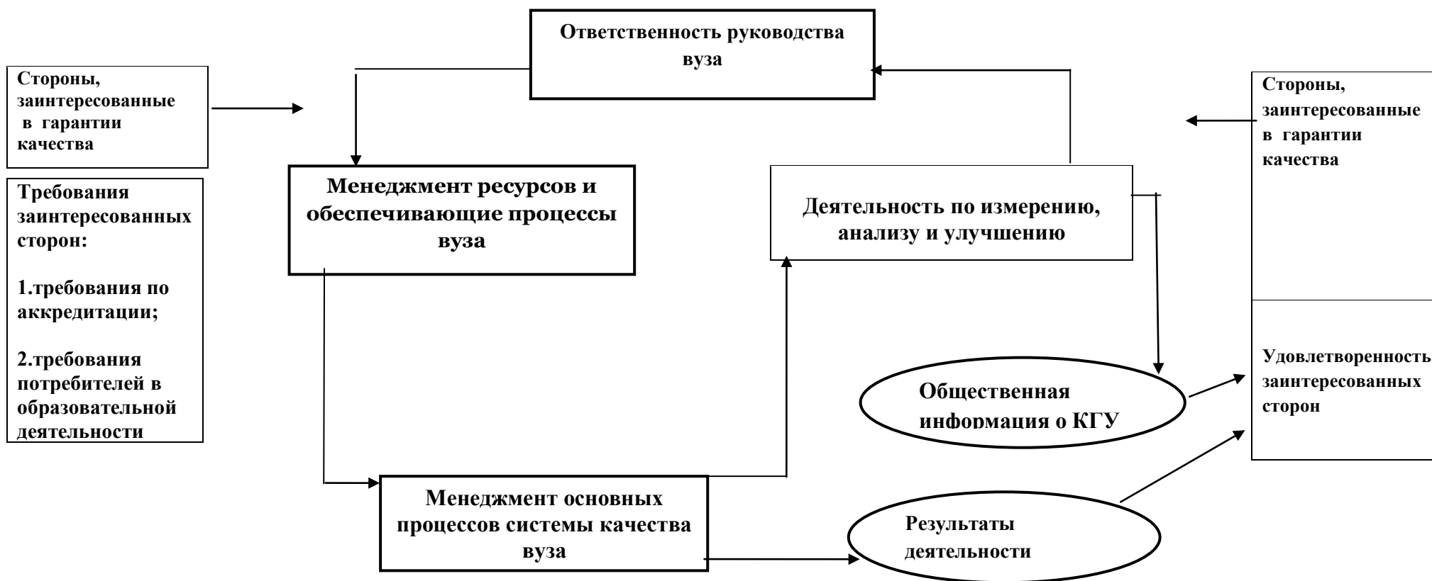
Рис. 2 Модель системы качества КГУ

В организационную структуру системы обеспечения качества в университете входят: